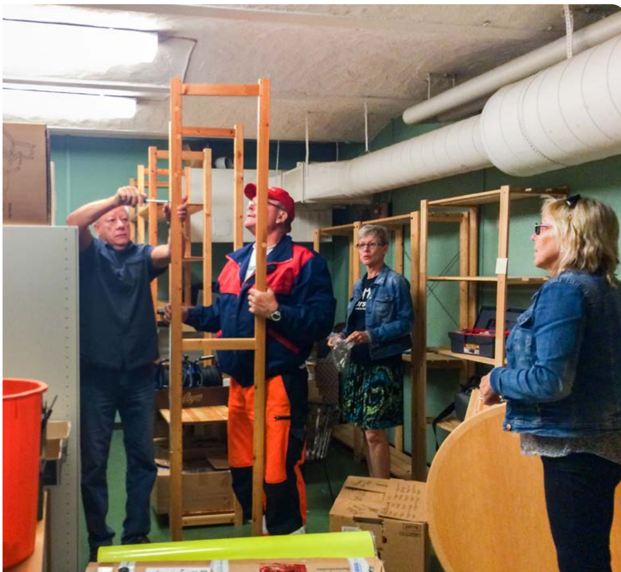
Så var det dags för flytt igen... Här är det näringslivskontoret som med hjälp av Komfix flyttar från kommunhuset till Dalagatan 1.

Det som är mest oroande och måste undersökas mer under året är de stora uppsägningarna på egen begäran samt att de korta sjukskrivningarna ökar. Det kan vara ett tecken på organisatoriska problem. Vi vet att framtiden kommer att ställa stora krav på varumärket Orsa kommun om vi ska klara personalförsörjningen.